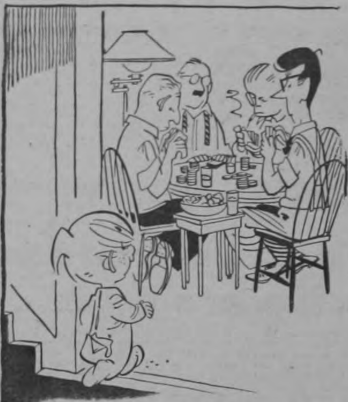
—Oí gente comiendo papitas fritas... ¿Es aquí?

Informamos en nuestra edición de ayer que los empresarios paperos de Cartago tenían una difícil situación al no encontrar mercado para sus productos. Se cree que el problema puede resolverse haciendo que la papa se consuma más en todo el país. El asunto ha interesado desde luego al Consejo Nacional de Producción en el sentido de estimular a los empresarios paperos a fin de obtener precios remunerativos para ellos. El año pasado el Consejo Nacional de Producción hizo gestiones para que los empresarios paperos exportaran 1000 sacos de esos ar-