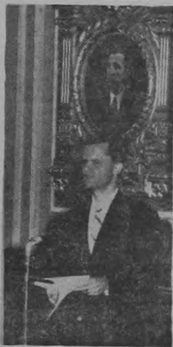
MINISTRO HESS... vigorosa y sesuda intervención...

La actual administración soporta cuantiosas pérdidas en sus ingresos. La Renta Bananera descendió en ₡ 23.000.000. Inyudaciones del año 1955, produjeron pérdidas de ₡ 50.000.000. La lucha nacional de enero de 1955 contra invasores extranjeros y fomentada por la oposición costó al país ₡ 12.000.000. Por otro lado esta administración con el establecimiento del trezavo mes liverte ₡ 11.000.000 anuales. Considerables aumentos de sueldos a maestros y empleados públicos