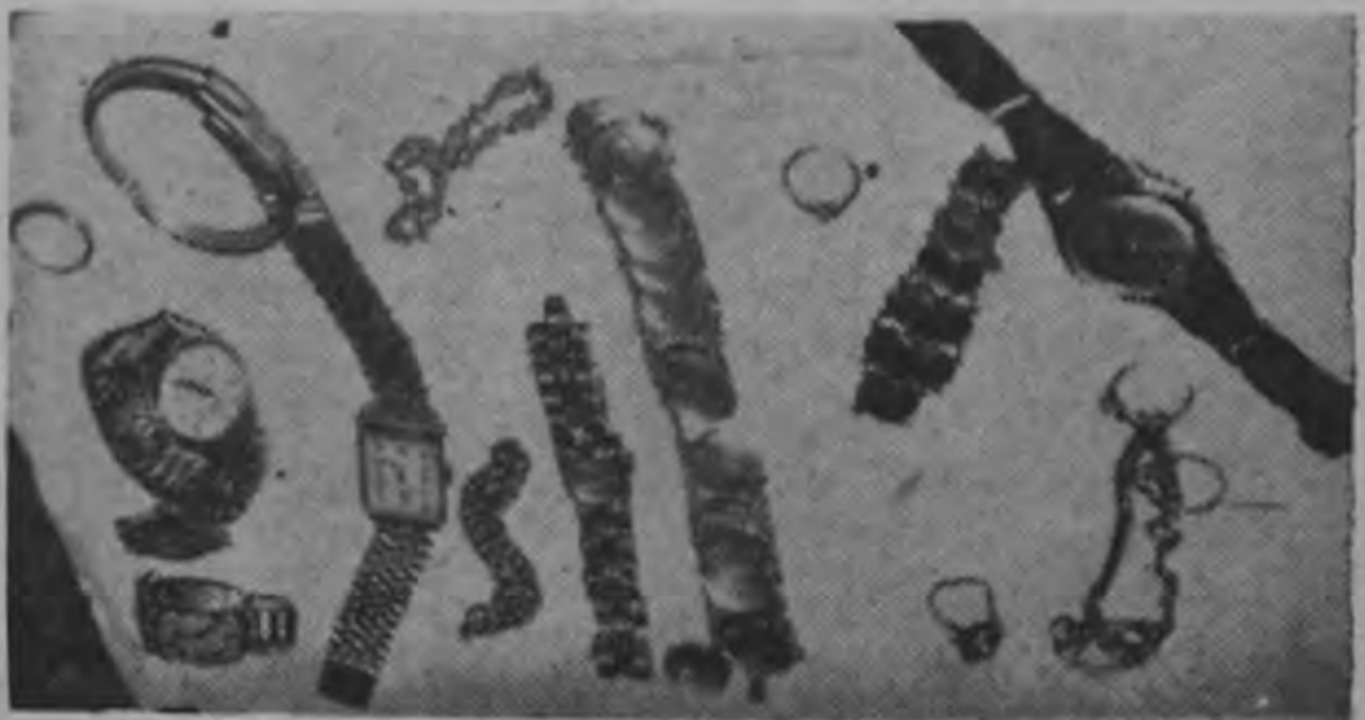
PARTE DE LO RECUPERADO. —Aparecen en la gráfica algunas de las prendas robadas por tres hampones en la casa del Sr. Piquín Brenes. Aunque lo que se nota pareciera realmente poco, los relojes en su mayoría son de oro macizo. Hay una sarta de anillos de brillantes y de piedras muy valiosas. Las investigaciones continúan, pues falta aún por ser capturado uno de los principales malhechores.—(Foto de Solano para LA REPUBLICA).