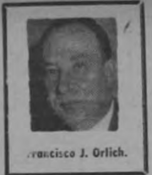
Francisco J. Orlich.