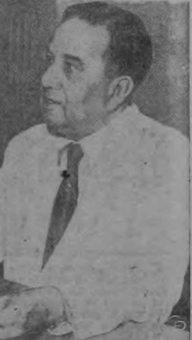
1.—El Primer Ministro Suhrawardy. El mapa muestra en negro el territorio de Paquistán.